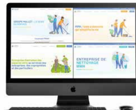
- 4 Sites web