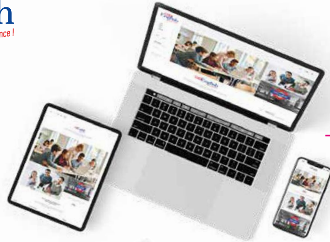
- Site web & Réseaux sociaux