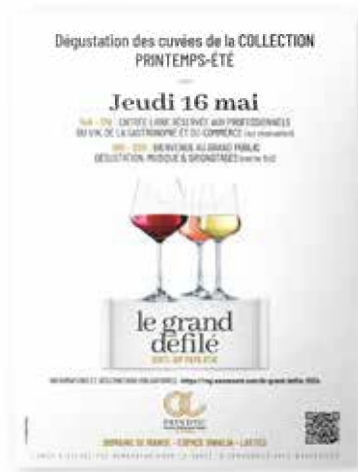
- Naming & création graphique