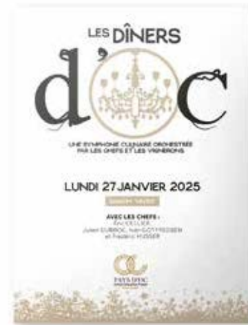
- Création concept & graphisme