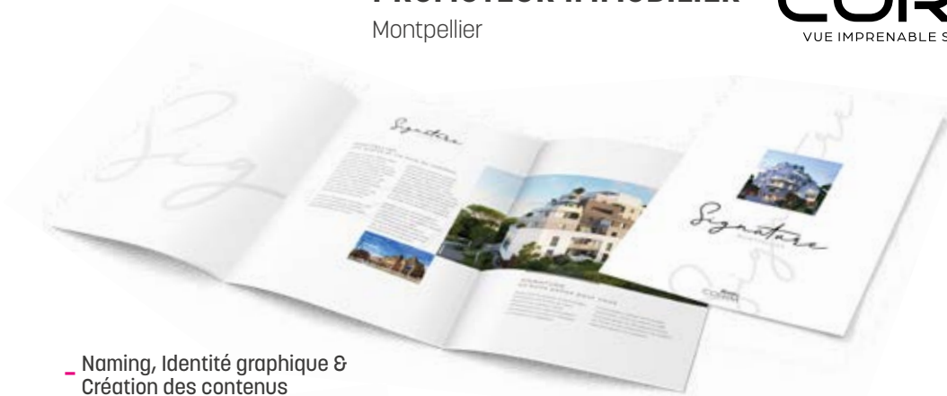
- Naming, Identité graphique & Création des contenus