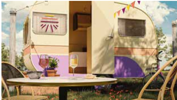
Création visuel 3D