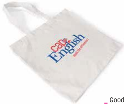
- Goodies Salons