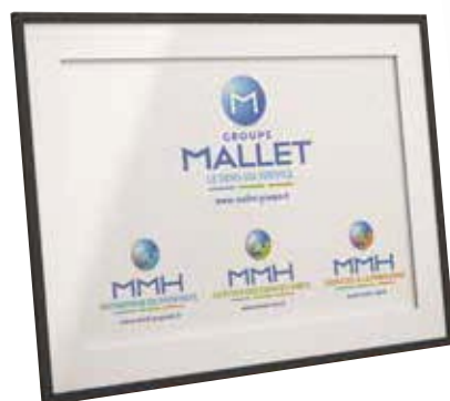
- Audit de communication - Refonte & création de l'identité graphique