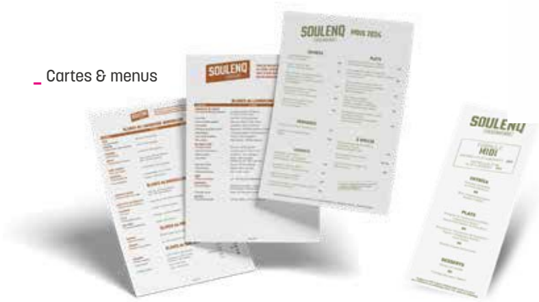
Cartes & menus