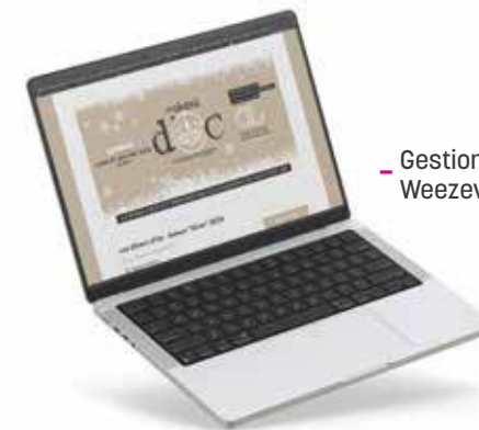
- Gestion Weezevent