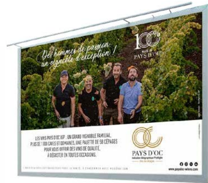
Création de l'identité visuelle & de la charte graphique