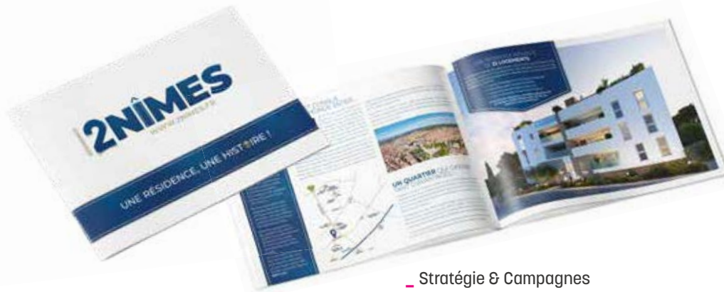
- Stratégie & Campagnes