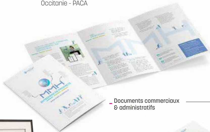
- Documents commerciaux & administratifs