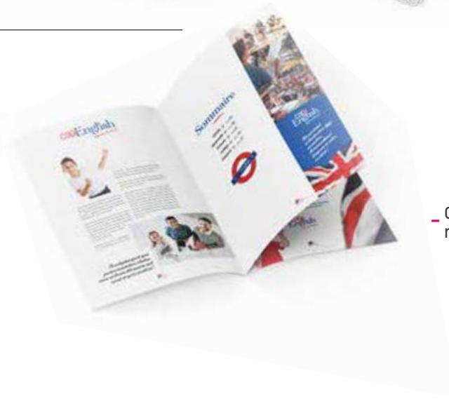
- Création des contenus rédactionnels