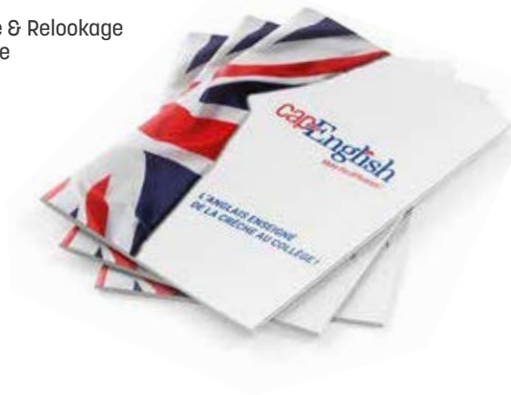
- Création graphique & Relookage de l'identité visuelle