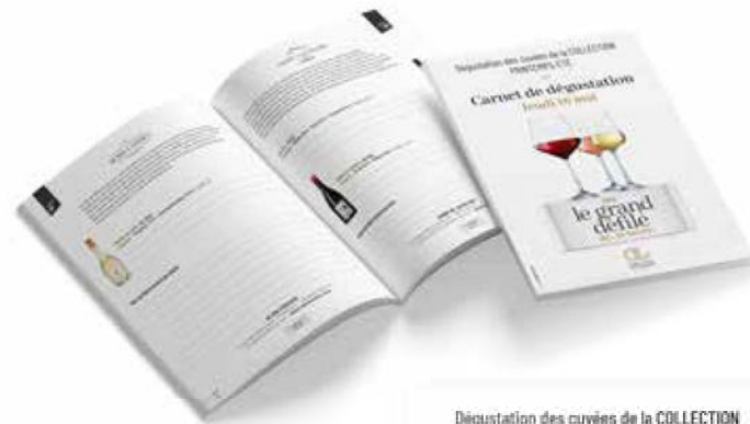
- Carnet de dégustation