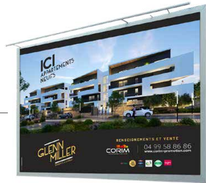
- Panneaux de vente